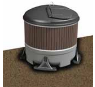
MolokClassic® Plus 3 m 3

Soveltuu mainiosti mm. seuraavien jakeiden keräykseen: