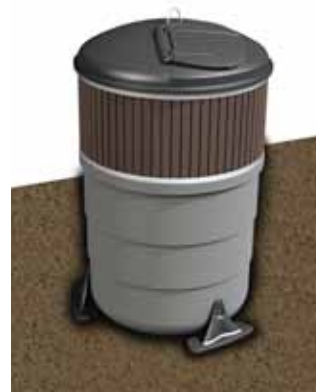
MolokClassic® 5 m 3

Yhteensopiva seuraavien Molok-jättesäiliöiden kanssa: