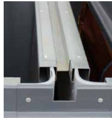
Kuva 1. U-listan kiinnitys