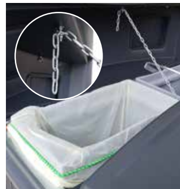
Kuva 4. Sivusaranan asennus