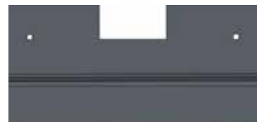
Kuva 3. Verhouksen jatkopalat A ja C